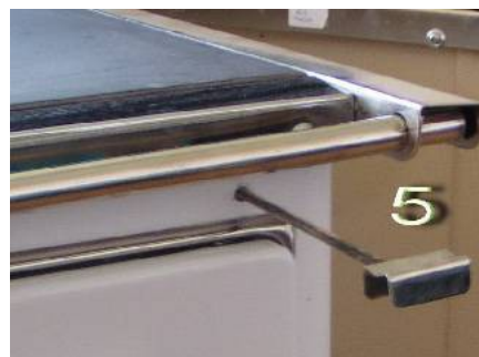
Regulátor průchodu vzduchu (všechny modely)

Sporáky jsou určeny k přípravě jídla (vaření, pečení) a k vytápění obytných prostor. Konstrukcí i způsobem používání se výrazně liší od klasických sporáků na pevná paliva, protože mají možnost regulace režimu provozu (má 4 režimy) a nastavení přívodu vzduchu pro spalování. Tyto přednosti umožňují větší účinnost a lepší stupeň využití tepelné energie.